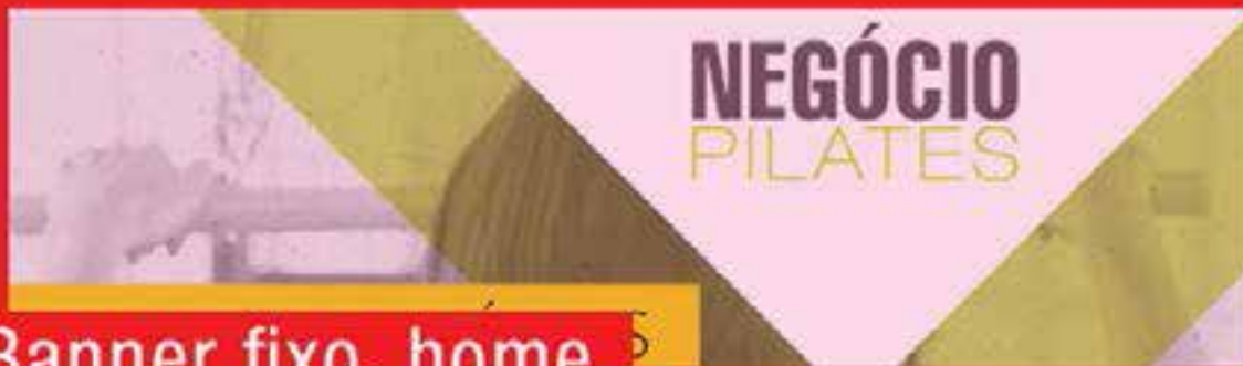
Banner fixo, home