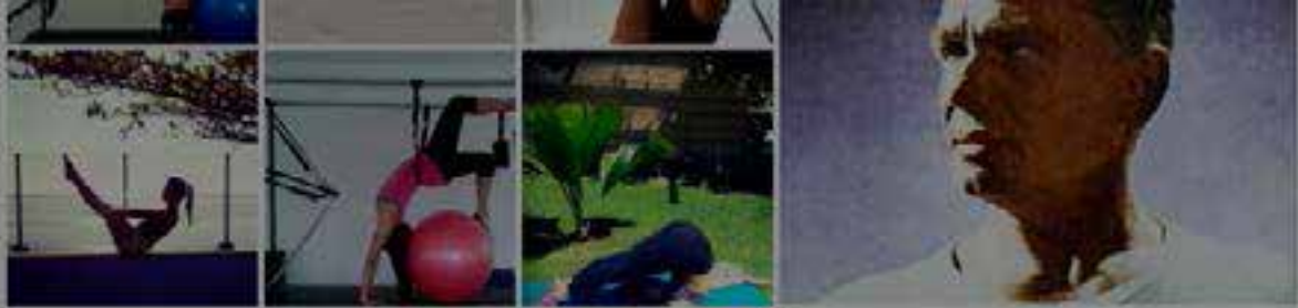
Galeria de fotos