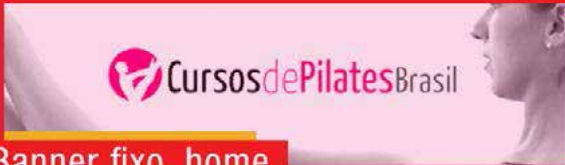
Banner fixo, home